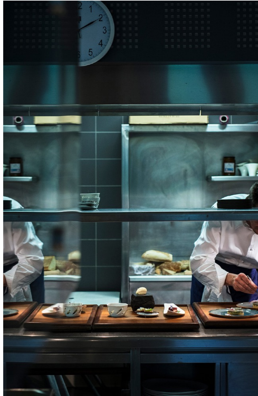
Reportages artistiques sur le monde de la restauration Création d'une communauté sur les réseaux sociaux au travers d'expositions virtuelles