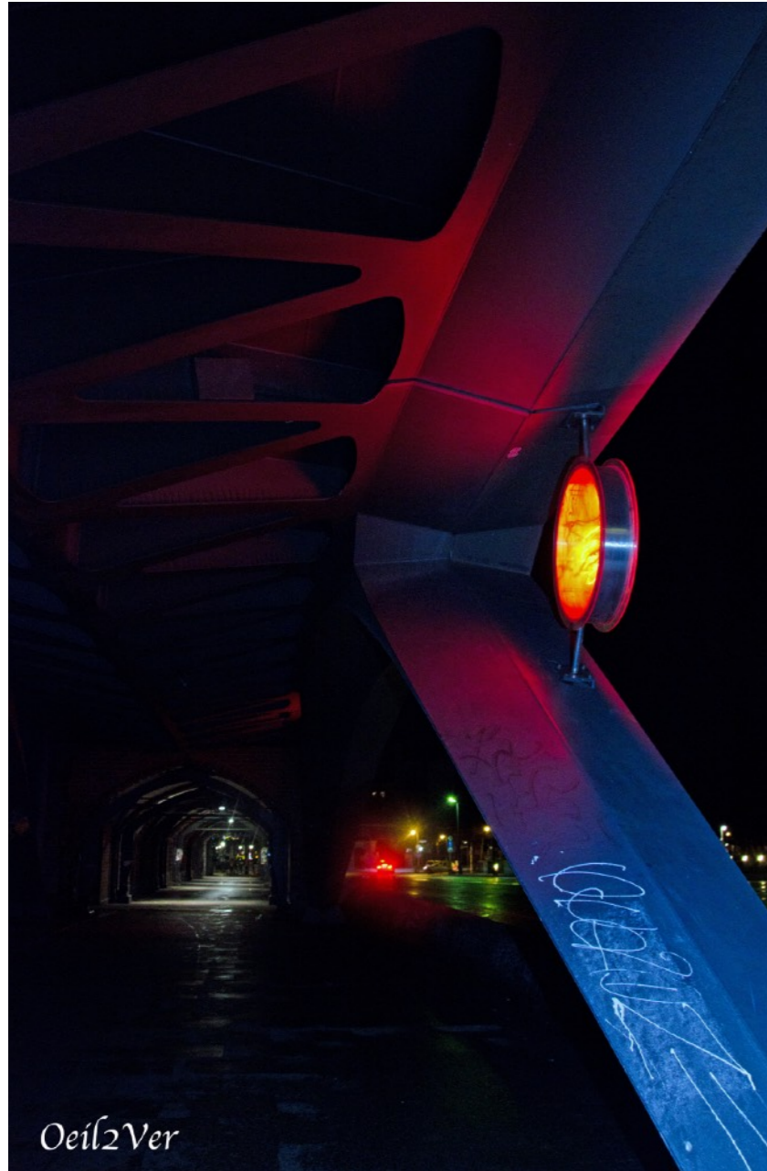
Exposition et utilisation lors de soirées privées « Monde vu par un Oeil2Ver »