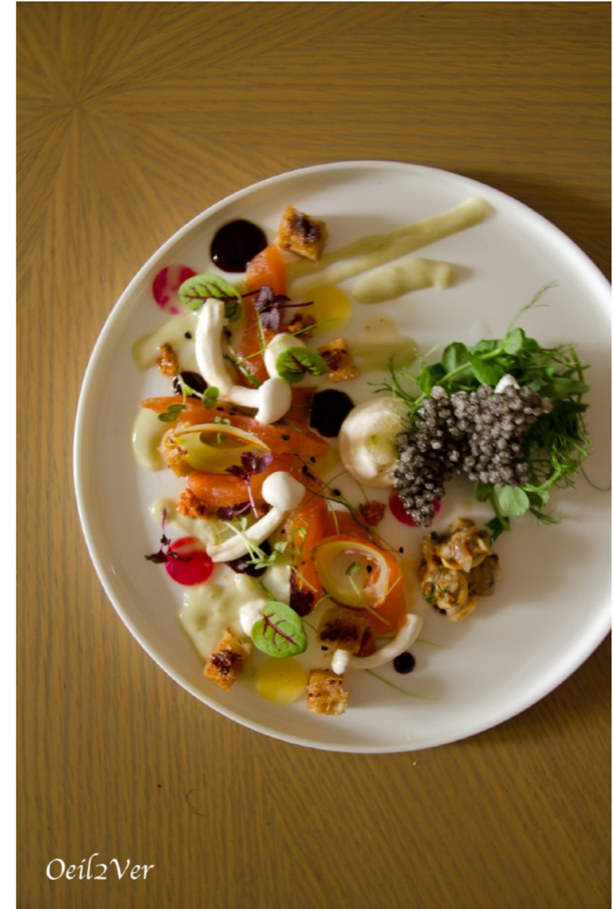
Photographies culinaires d'assiettes de chef